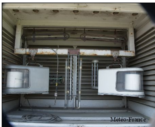
Photo 1 : Thermomètres à minimum et maximum (en haut) et thermographe dans l'abri Stevenson

Avec l'avancée de la technologie et de l'acquisition numérique, l'instrument de mesure de la température, utilisé de nos jours dans les stations automatiques de Météo-France, est la sonde thermométrique à résistance de platine.